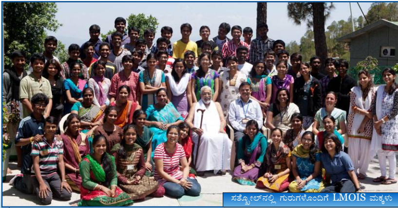
ಸತ್ಯೋಲ್‌ನಲ್ಲಿ ಗುರುಗಳೊಂದಿಗೆ LMOIS ಮಕ್ಕಳು

22ರ ಮಧ್ಯಾಹ್ನ ಮಲೇಶಿಯಾ ಆಶ್ರಮದ ಹಾಗೂ ಏಶಿಯಾದ ಸಮ್ಮೇಳನದ ಉದ್ಘಾಟನೆಗಾಗಿ ಗುರುಗಳು ಮಲೇಶಿಯಾಗೆ ತೆರಳಿದರು.