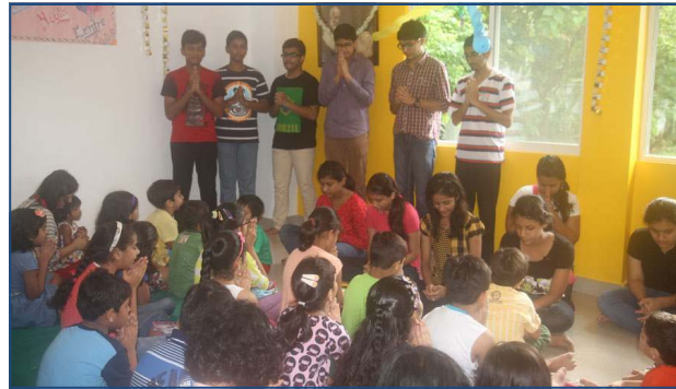
குழந்தைகள் மற்றும் இளைஞர் மையம், கொல்கத்தா