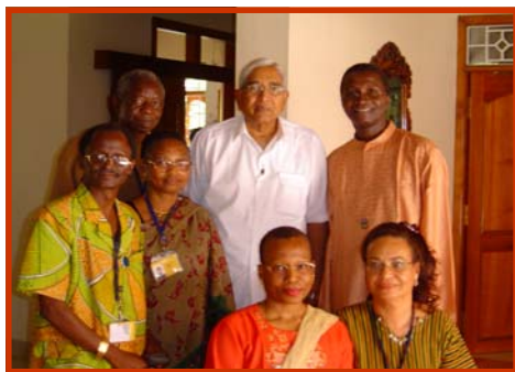
A Manapakkam, le Maître, avec un groupe de précepteurs d'Afrique, en janvier 2004

C'est notamment sur la base de ces indicateurs et d'autres éléments qui sont fournis par les précepteurs que des avis sont formulés sur les besoins des centres en bourses de formation à Manapakkam, en Inde.