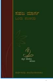
સહજ માર્ગ શું છે કન્નડ