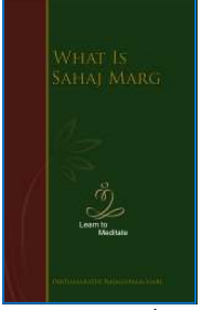
સહજ માર્ગ શું છે ઈંગ્લીશ