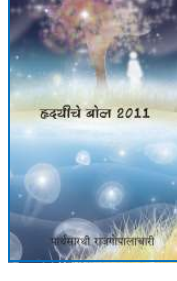
હાર્ટ સ્પીક 2011 મરાઠી