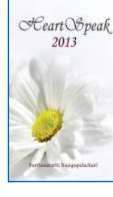
હાર્ટ સ્પીક 2013 ઈંગ્લીશ