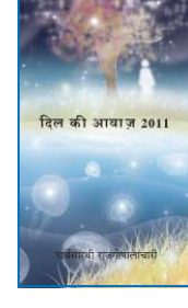
હાર્ટ સ્પીક 2011 હિન્દી