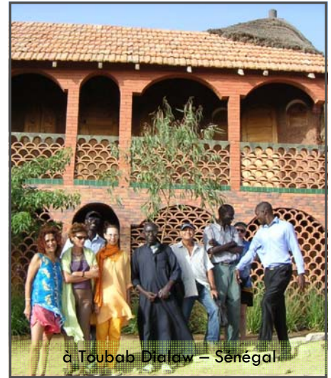
à Toubab Dialaw – Sénégal