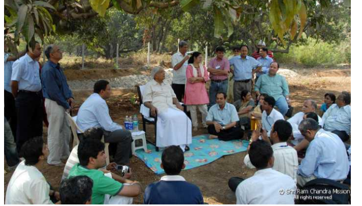
Panvel Ashram - Under the mango trees