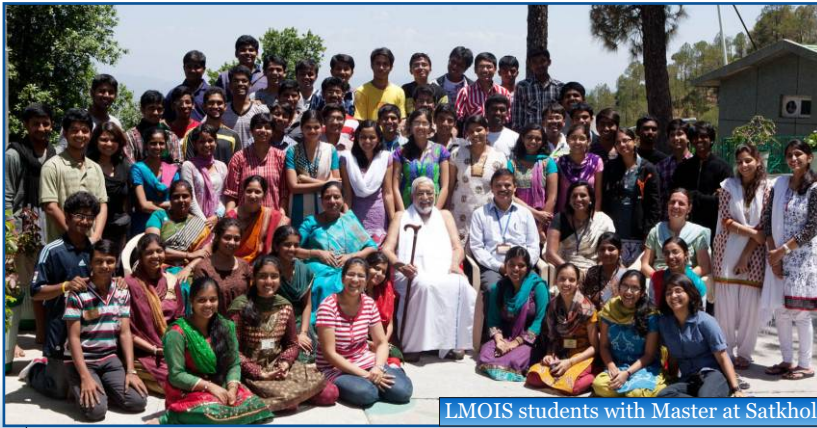
LMOIS students with Master at Satkhol

మాస్టరు 22 మధ్యాహ్నం మలేషియన్ ఆశ్రమాన్ని, ఏశియన్ సెమినార్ ను ప్రారంభించటానికి, మలేషియాకు ప్రయాణమయ్యారు.