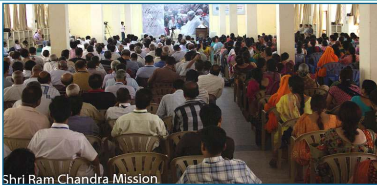
Shri Ram Chandra Mission

క్రిందటి రోజు లక్షో అభ్యాసులను కలువలేకపోయినందున, డార్క్ A లో ఉదయం 11 గంటలకు వాళ్ళను కలవాలని మాస్టర్ అనుకున్నారు. మాస్టర్ హిందీలో ఉపన్యసిస్తూ భవిష్యత్ కోసం మంచి పనులను వాయిదా వేయరాదని, వర్తమానంలో అప్పటికప్పుడు చెయ్యటంలోని అవసరాన్ని, ప్రాముఖ్యత లోని శాచిత్యాన్ని స్పష్టకరించారు. వయస్సు మళ్ళీన తరువాత ఆధ్యాత్మికతను ఆశ్రయించడం తెలివి తక్కువతనం అని అన్నారు. మాస్టర్ వివేకం గురించి బాబుజీ గారు అన్న మాటలను పునఃశ్చరించారు-"మరుక్షణంలోనే చనిపోతామనేలా జీవించే వివేకం కలిగి ఉండాలి" అని అన్నారు. ఉదయమే అభ్యాసులు సత్సంగుకు హాజరు అయినందున మళ్ళీ సిట్టింగ్ కావాలా అని ప్రసంగం తరువాత అడిగారు. అభ్యాసీలు సత్సంగ్ కావాలని అభ్యర్థించారు. సమావేశమైన అభ్యాసీలు సెమినార్ లో ఆయన చుట్టూ గుమికూడకపోవడంతో, క్రమశిక్షణనూ, నిశ్శబ్దతనూ పాటించడం వలన ఆయన స్వేచ్ఛగా నడవగలిగారు.