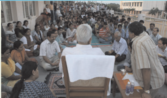
With LMOIS Students