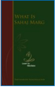
ವಾಟ್ ಈಜ್ಜ್ ಸಹಜ್‌ಮಾರ್ಗ್ ಆಂಗ್ಲ