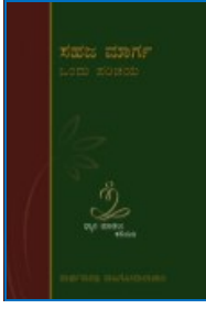
ಸಹಜಮಾರ್ಗ ಒಂದು ಪರಿಚಯ