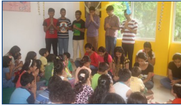
ಚಿಣ್ಣರು ಮತ್ತು ಯುವ ಕೇಂದ್ರ, ಕೋಲ್ಕಾತಾ