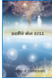
ಹಾರ್ಟ್‌ಸ್ಪೀಕ್ 2011 ಮರಾಠಿ