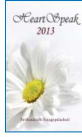
ಹಾರ್ಟ್‌ಸ್ಪೀಕ್ 2013 ಆಂಗ್ಲ