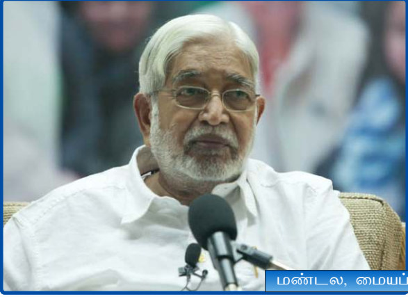
மண்டல, மையப் பொறுப்பாளர்கள் பணிமுகாம்