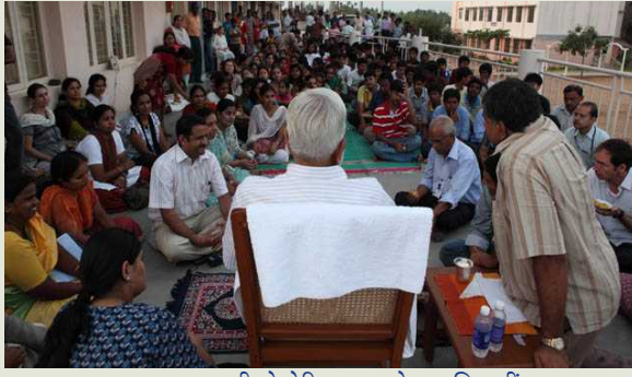
लालाजी मेमोरिअल शाळेच्या विद्यार्थी सह