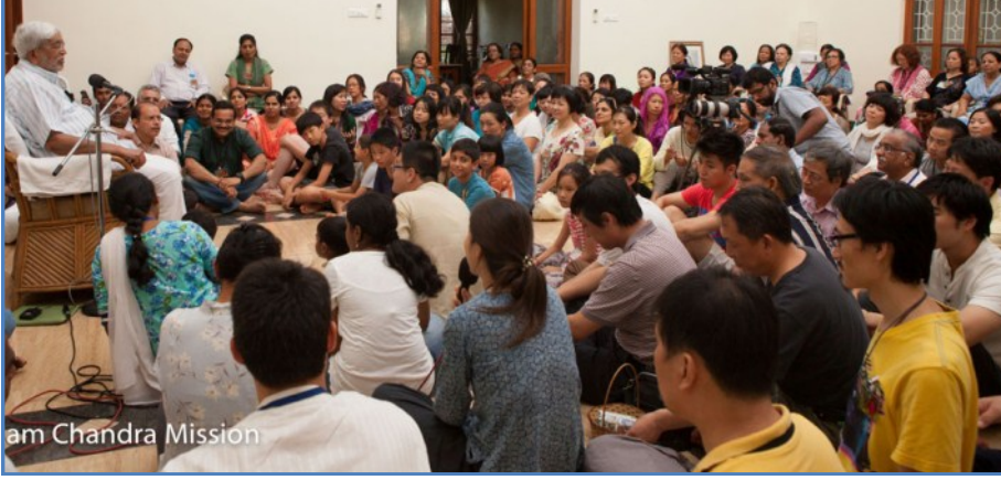
Shri Ram Chandra Mission