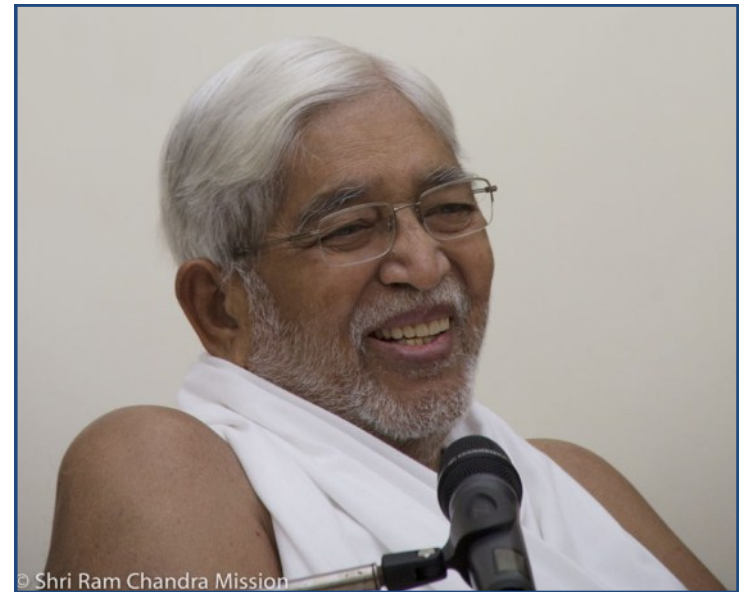
Shri Ram Chandra Mission

ಗುರುಗಳು ಸೇರಿದ್ದ ಎಲ್ಲರಿಗೂ ಕೊಡಲೆಂದು ಸಿಹಿ ಮತ್ತು ಕಚ್ಚಾಯಗಳನ್ನು ತಯಾರಿಸಲು ಅಡುಗೆಮನೆ ತಂಡಕ್ಕೆ ಹೇಳಿದರು. ಚೀನೀ ಮತ್ತು ವಿಯೆಟ್ನಾಮಿ ಅಭ್ಯಾಸಿಗಳು ಒಂದು ಪುಟ್ಟ ಸಾಂಸ್ಕೃತಿಕ ಕಾರ್ಯಕ್ರಮವನ್ನು ನೀಡಿದರು. ಈ