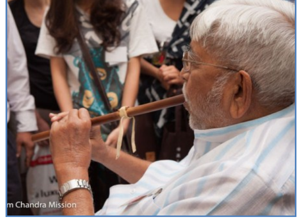
Shri Ram Chandra Mission