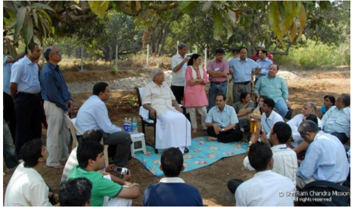
Panvel Ashram - Under the mango trees

മാർച്ച് 17 ന് മാസ്റ്റർ പുനയിൽ നിന്നും റോഡുമാർഗം പൻവേൽ ആശ്രമത്തിലെത്തി. 1400 ഓളം വരുന്ന അഭ്യാസികൾ മാസ്റ്ററെ സന്തോഷം, ഹൃദയപൂർവ്വം എതിരേറ്റു. ഓരോരുത്തരുടെയും സ്നേഹപ്രകടനത്തെ മാസ്റ്റർ കൈവീശിക്കൊണ്ട് സ്വീകരിക്കുന്നത് നയനാനന്ദകരമായ കാഴ്ചയായിരുന്നു. കൊച്ചുകുട്ടികൾക്ക് മാസ്റ്ററുടെ വടികൊണ്ടുള്ള ആശീർവാദവും ഉണ്ടായിരുന്നു. ആശ്രമത്തിലെത്തിയ മാസ്റ്റർ സത്സംഗം നിർവഹിച്ചു. വളരെ ഗാഢമായ ആ സിറ്റിങ്ങിൽ അവിടെ സന്നിഹിതരായിരുന്ന ഓരോരുത്തരും സ്നേഹത്തിന്റെ സൂക്ഷ്മവും ശക്തവുമായ ഒഴുക്ക് അനുഭവിച്ചു.