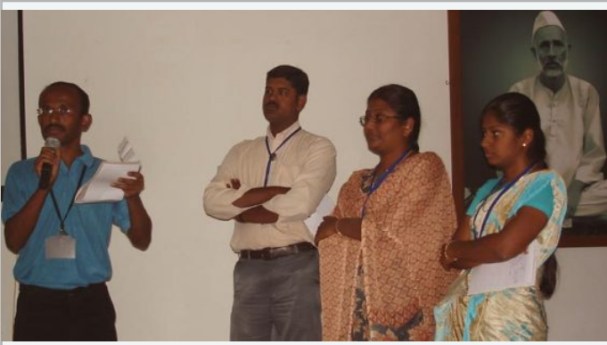
Youth Workshop, Coimbatore