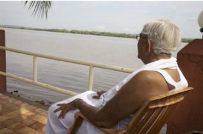
Master on the banks of the Mandovi, Goa

മാസ്റ്ററുടെ മുംബൈ സന്ദർശനം "ഹോളി" ആഘോഷവേളയിലായിരുന്നു. ദുഷ്ടതയും, അഴുക്കുകളും "ഹോളി" അഗ്നിയിൽ കത്തിച്ചു കൊണ്ട് ആളുകൾ ആ അഗ്നിക്ക് ചുറ്റും നൃത്തം ചെയ്യുക പതിവാണ്. അഗ്നി എല്ലാത്തിനെയും പവിത്രമാക്കുന്ന, നിറങ്ങളുടെ ഉൽസവമായ ഹോളി പുനരുജ്ജീവനത്തെ സൂചിപ്പിക്കുന്നു. വാസ്തവത്തിൽ നിറങ്ങൾ ഒന്നും തന്നെ ദൃശ്യമായിരുന്നില്ലെങ്കിലും എല്ലാവരുടെ ഹൃദയങ്ങളിലും സമാധാനവും, സ്നേഹവും, സന്തോഷവും അനുഭവവേദ്യമായിരുന്നു.