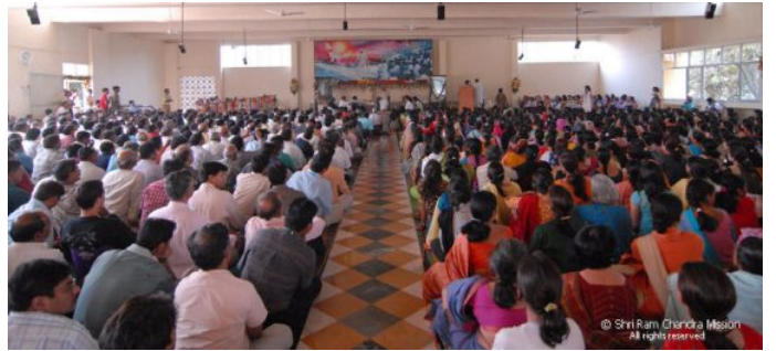
Panvel Ashram - Meditation Hall

മാസ്റ്റർ ആശ്രമത്തിന്റെ ഓരോ മുക്കും മൂലയും പരിശോധിച്ചു. ട്രാൻസിനു മുകളിൽ ചെന്നുനിന്ന് താഴെയുള്ള ഹരിതാഭയും ആസ്വദിച്ചു. മാർച്ച് 18 ന് മാസ്റ്റർ സത്സംഗം നടത്തിയതിനുശേഷം 'ഹാർട്ട് സ്പീക്ക് 2005' ന്റെ മറാഠി പരിഭാഷ പ്രകാശനം ചെയ്യുകയുണ്ടായി. അതിനുശേഷം മാസ്റ്റർ 'ഗ്രീൻ സോണി'ൽ ഒരു വൃക്ഷത്തെ നട്ടു. തിരിച്ചു തന്റെ കോട്ടേജിലേക്ക് വരുന്ന വഴിയിൽ തണലിലിരുന്ന് ഇസ്രായേലിലെ അഭ്യാസികളുമായി സൗഹൃദസംഭാഷണം നടത്തി. ആ രാജ്യങ്ങൾ സന്ദർശിച്ചപ്പോൾ അദ്ദേഹത്തിനനുഭവിക്കേണ്ടിവന്ന പ്രശ്നങ്ങളെക്കുറിച്ച് അദ്ദേഹം വിശദീകരിച്ചു. രാത്രി ഒമ്പതു മണിയോടുകൂടി ഡൈനിങ് ഹാളിനടുത്തുണ്ടായിരുന്ന സ്ഥലത്ത് അദ്ദേഹം കുറച്ചു സമയം അഭ്യാസികളുമായി ചിലവഴിച്ചു.