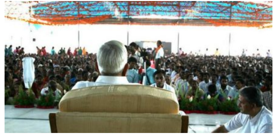
ഏതാണ്ട് രണ്ടായിരത്തി അഞ്ഞൂറ് അഭ്യാസികൾക്ക് ഇരിക്കുവാൻ സൗകര്യമുള്ളതാണ്.