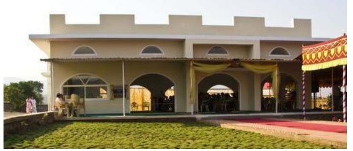
CREST Retreat Centre, Panshet

2008 മാർച്ച് 14ന് മാസ്റ്റർ ഇന്ത്യയിലെ രണ്ടാമത്തെ 'റിട്രിറ്റ്' കേന്ദ്രം ഉദ്ഘാടനം ചെയ്തു. മഹാരാഷ്ട്രയിൽ പുനയുടെ പ്രാന്തപ്രദേശത്ത് സ്ഥിതിചെയ്യുന്ന ഒരു സ്ഥലമാണിത്. പാൻഷെറ്റ് അണക്കെട്ടിന്റെ സമീപത്തായുള്ള, മലകളാൽ ചുറ്റപ്പെട്ടുകിടക്കുന്ന ഘടക് വസൽ തടാകത്തിനടുത്താണ് ഈ റിട്രിറ്റ് സെന്റർ. ധ്യാനമന്ദിരവും അടുക്കളയും ഡൈനിംഗ് ഹാളും ഡോർമിറ്ററിയും ചേർന്നതാണ് ഈ കേന്ദ്രം. ഈയിടെ മാസ്റ്റർ ഉദ്ഘാടനം നിർവഹിച്ച മലമ്പുഴയിലെ റിട്രിറ്റ് സെന്റർ പോലെ തന്നെ ഇതും 2008 ഏപ്രിൽ 14 മുതൽ പ്രവർത്തനം ആരംഭിക്കുന്നതാണ്.