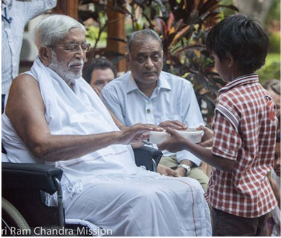
Shri Ram Chandra Mission