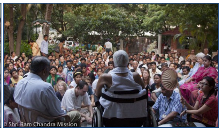
Shri Ram Chandra Mission