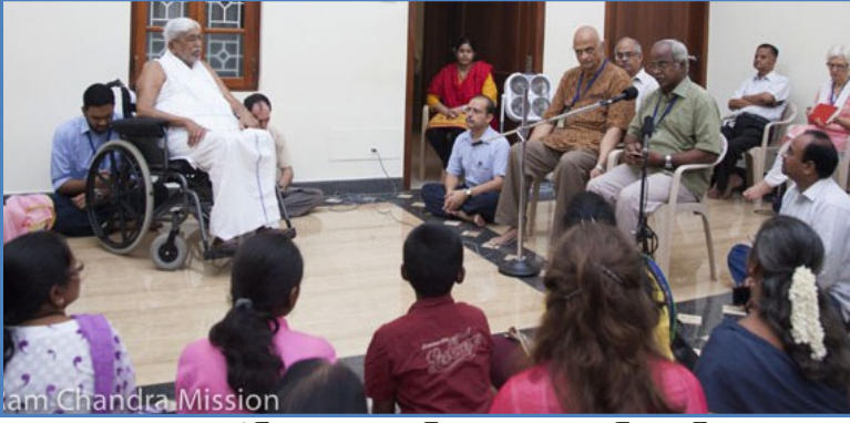
am Chandra Mission