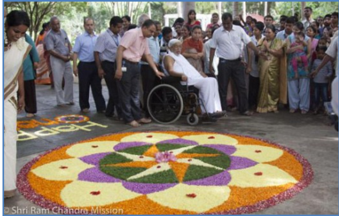
Shri Ram Chandra Mission