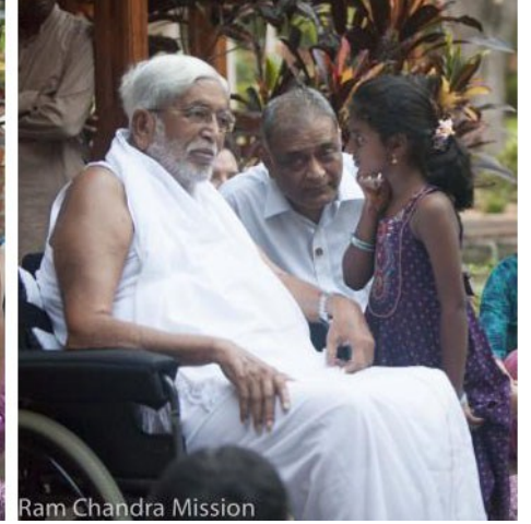
Ram Chandra Mission