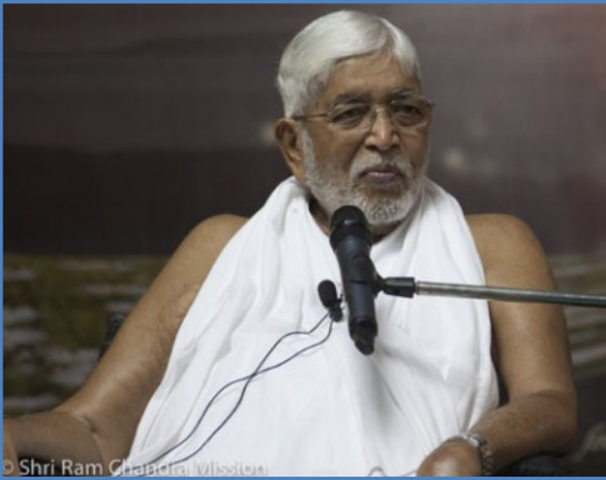
Shri Ram Chandra Mission

ఆదివారం సెప్టెంబర్ ఇరవై రెండున మాస్టర్ గారు,