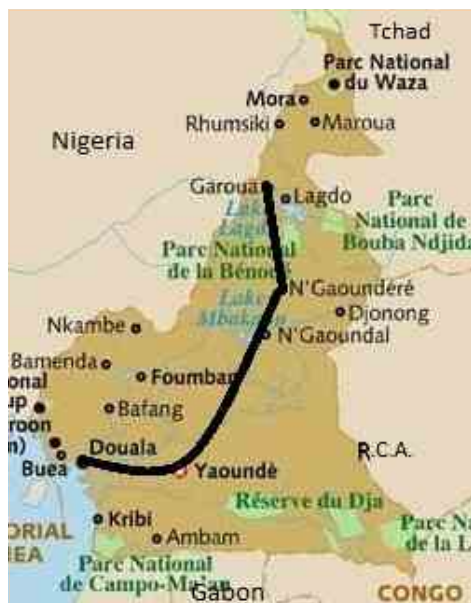
Carte du Cameroun

Distance parcourue de Douala à Garoua, par Yaoundé: 1400 Kilomètres.