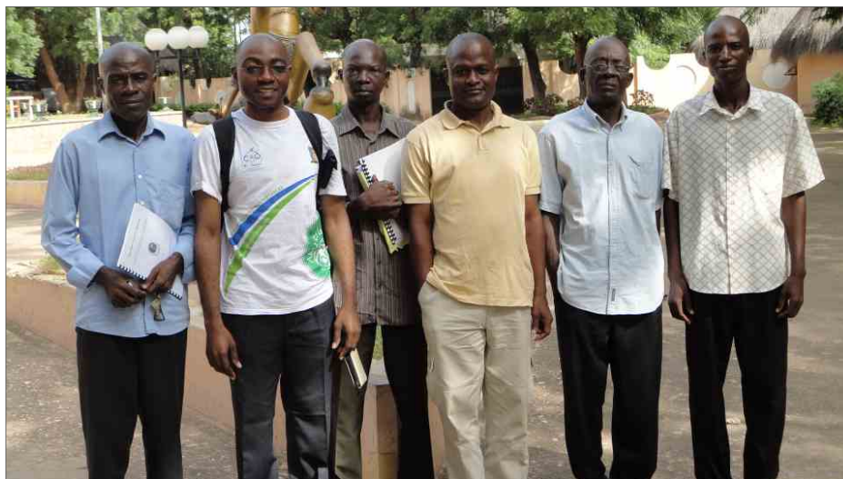
Abhyasis de Garoua. Le précepteur visiteur est le 2ème à partir de la gauche

Je me suis installé dans un hôtel au cœur de Garoua, une belle et vaste propriété entourée d'arbres fruitiers dans lesquels nichaient de multiples oiseaux. Tout ceci créait une belle ambiance propice au repos,