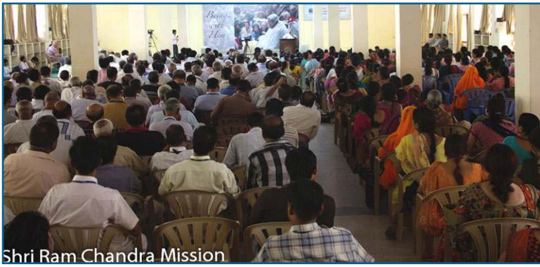
Shri Ram Chandra Mission