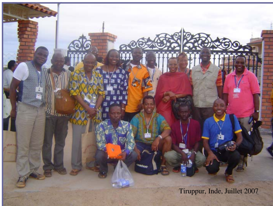
Tiruppur, Inde, Juillet 2007