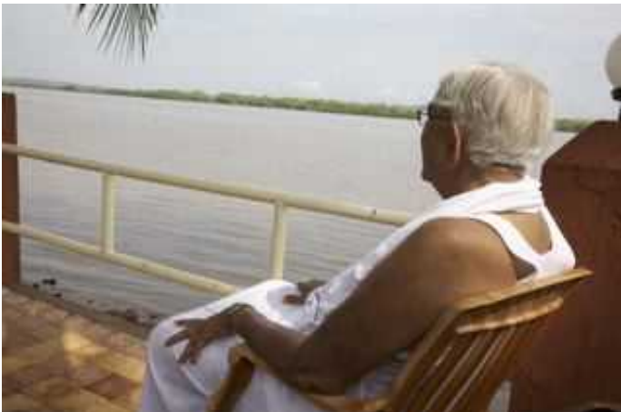
Master on the banks of the Mandovi, Goa

गुरुदेवांची ही मुंबई भेट 'होळी'च्या सणा दिवशी झाली. या दिवशी दुष्ट प्रवृत्ती व अपवित्रतेला होळीच्या ज्वाळांमध्ये जाळून खाक केले जाते. त्यानंतर लोकपवित्र केलेल्या त्या होळीच्या भोवताली नृत्य करतात. हा सण रंगाचा सण आहे ज्यामध्ये रंग हे जीवनाला पुन्हा ताजे-तवाने करण्याचे प्रतीक आहे. हे खरे आहे की तेथे कोणत्याही प्रकारचे रंग नव्हते परंतु प्रत्येकाला त्याच्या हृदयाच्या खोल गाभाऱ्यात शांतीच्या, प्रेमाच्या व आनंदाच्या विविध छटा जाणवत होत्या.