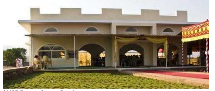
SMSF Retreat Centre, Panshet