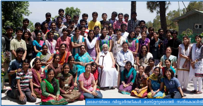
ഒമേഗയിലെ വിദ്യാർത്ഥികൾ മാസ്റ്ററുമൊത്ത് സത്കോലിൽ

മലേഷ്യൻ ആശ്രമവും ഏഷ്യൻ സെമിനാറും ഉദ്ഘാടനത്തിനായി മാസ്റ്റർ 22 ന് ഉച്ചക്കുശേഷം മലേഷ്യക്കു തിരിച്ചു.