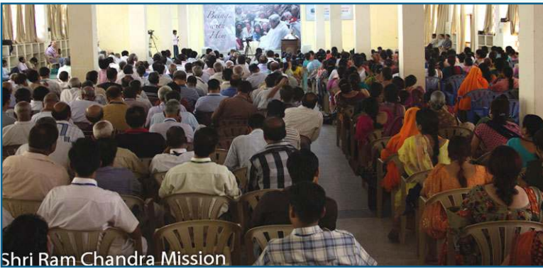
Shri Ram Chandra Mission

കഴിഞ്ഞ ദിവസം മാസ്റ്റർക്ക് ലക്നൗവിലെ അഭയാസികളെ കാണാൻ കഴിയാതിരുന്നതുകൊണ്ട് അദ്ദേഹം അവരെ രാവിലെ 11 മണിക്ക് ഡോർമിറ്ററി 'എൽ വെച്ച് കാണാൻ തീരുമാനിച്ചു. മാസ്റ്റർ ഹിന്ദിയിൽ നൽകിയ പ്രഭാഷണത്തിൽ, നല്ല കാര്യങ്ങൾ നാളത്തേക്ക് മാറ്റിവെക്കാതെ ഇന്നുതന്നെ ചെയ്യേണ്ടതിന്റെ ആവശ്യകതയും പ്രാധാന്യവും ഊന്നിപ്പറഞ്ഞു. പ്രായം കൂടുന്നതിന്റെ അനിവാര്യമായ പ്രക്രിയയെ കുറിച്ചും പ്രായമാവുമ്പോൾ ആത്മീയാന്വേഷണം നടത്താമെന്ന ചിന്ത എത്ര തെറ്റാണെന്നും അദ്ദേഹം വിശദീകരിച്ചു. അടുത്ത നിമിഷം മരിക്കാൻ പോവുകയാണെന്ന മട്ടിൽ ജീവിക്കുന്നതാണു വിവേകം എന്ന ബാബുജിയുടെ പ്രസ്താവന അദ്ദേഹം ആവർത്തിച്ചു. പ്രഭാഷണത്തിനു ശേഷം, രാവിലത്തെ സത്സംഗത്തിൽ എല്ലാവരും പങ്കെടുത്തതിനാൽ ഇനിയൊരു സിറ്റിംഗ് വേണോ എന്ന് അദ്ദേഹം ചോദിച്ചു. അഭയാസികൾ സിറ്റിംഗിനു വേണ്ടി അപേക്ഷിച്ചു. അവിടെ കൂടിയിരുന്ന അഭയാസികൾ പരിപാടി കഴിയുന്നതുവരെ കൂടിനിന്ന് ശല്യം ചെയ്യാതെ വളരെ അച്ചടക്കത്തോടെയും നിശ്ശബ്ദതയോടെയും ഇരുന്നുകൊണ്ട് മാസ്റ്റർക്ക് സ്വതന്ത്രമായി നടന്നു പോകാൻ സൗകര്യം ചെയ്തുകൊടുത്തു.