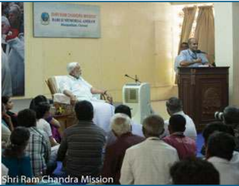
Shri Ram Chandra Mission