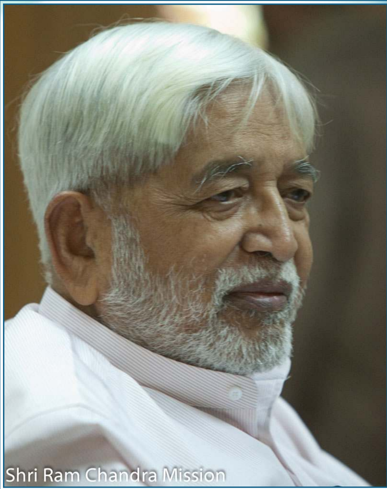
Shri Ram Chandra Mission