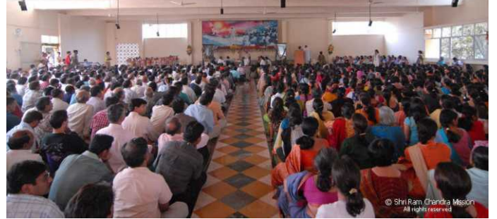
Panvel Ashram - Meditation Hall

ಗುರುಗಳು ಆಶ್ರಮದ ಮೂಲೆ ಮೂಲೆಯನ್ನೂ ನೋಡಿ ಪ್ರತಿ ಕೋಣೆಗೂ ಇಣುಕಿದರು. ನಂತರ ಮೇಲ್ಭಾಗದಿಂದ 'ಹಸಿರುವಲಯ'ದಡೆಗೆ ದೃಷ್ಟಿಹಾಯಿಸಿದರು. 18ರ ಬೆಳಿಗ್ಗೆ ಗುರುಗಳು ಸತ್ಸಂಗ ನಡೆಸಿದ ನಂತರ 'ಹೃದಯವಾಣಿ 2005'ರ ಮರಾಠಿ ಅನುವಾದವನ್ನು ಬಿಡುಗಡೆ ಮಾಡಿದರು. ತದನಂತರ ಗುರುಗಳು ಹಸಿರು ವಲಯಕ್ಕೆ ತೆರಳಿ ಸಸಿಯೊಂದನ್ನು ನೆಟ್ಟರು; ತಮ್ಮ ಕಾಟೇಜಿಗೆ ಹಿಂತಿರುಗುವ ಮಾರ್ಗದಲ್ಲಿ ನೆರಳಿನಲ್ಲಿ ಕುಳಿತು ಇಸ್ರೇಲಿನ ಕೆಲ ಅಭ್ಯಾಸಿಗಳೊಂದಿಗೆ ಉಲ್ಲಾಸಭರಿತ ಮಾತುಕತೆಯಲ್ಲಿ ತೊಡಗಿದರು. ಆ ದೇಶಗಳ ಭೇಟಿಯ ಸಂದರ್ಭದಲ್ಲಿ ತಮಗಾದ ಅನುಭವಗಳು ಮತ್ತು ತೊಂದರೆಗಳನ್ನು ವಿವರಿಸಿದರು. ರಾತ್ರಿ 9ರ ಸುಮಾರಿನಲ್ಲಿ ಅವರು ಭೋಜನ ಶಾಲೆಯ ಪಕ್ಕದ ಮೊಗಸಾಲೆಯಲ್ಲಿ ಅಭ್ಯಾಸಿಗಳೊಂದಿಗೆ ಸ್ವಲ್ಪ ಕಾಲ ಕಳೆದರು.