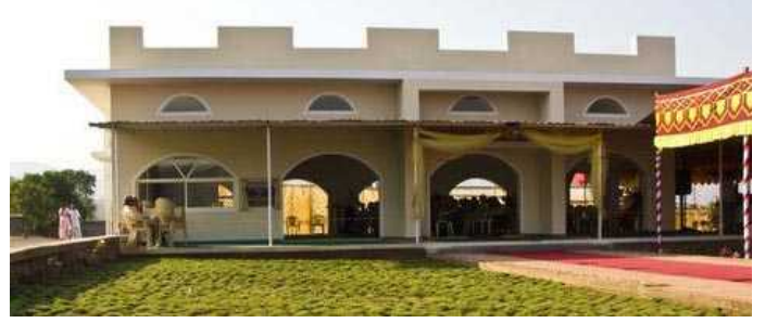
CREST Retreat Centre, Panshet

ಮಾರ್ಚ್ 14, 2008ರಂದು ಪೂಜ್ಯ ಗುರುಗಳು ಭಾರತದ ಎರಡನೆಯ ಆಶ್ರಯ ತಾಣವನ್ನು ಉದ್ಘಾಟಿಸಿದರು; ಇದು ಮಹಾರಾಷ್ಟ್ರದಲ್ಲಿ ಪುಣೆಯ ಹೊರವಲಯದಲ್ಲಿ ಚಿತ್ತಾಕರ್ಷಕ ಪರಿಸರದಲ್ಲಿ ನೆಲೆದಿದೆ. ಈ ಆಶ್ರಯ ತಾಣವು ಪನ್‌ಷೆಟ್ ಅಣೆಕಟ್ಟಿನ ಖಡಕವಾಸಲ ಸರೋವರದ ದಂಡೆಯ ಮೇಲಿದ್ದು ಬೆಟ್ಟದ ಸಾಲಿನಿಂದ ಆವೃತವಾಗಿದೆ. ಈ ವ್ಯವಸ್ಥೆಯು ಧ್ಯಾನ ಮಂದಿರ, ಪಾಕಶಾಲೆ ಮತ್ತು ಭೋಜನ ಸ್ಥಳ, ನಿವಾಸದ ಕಟ್ಟಡಗಳನ್ನೊಳಗೊಂಡಿದೆ. ಕೇರಳದ ಮಲಪುಳ್ಳದಲ್ಲಿ ಇತ್ತೀಚೆಗೆ ಉದ್ಘಾಟಿತವಾದ ಆಶ್ರಯತಾಣದಂತೆಯೇ ಇಲ್ಲಿನ ವ್ಯವಸ್ಥೆಯೂ ಸಹ. ಇಲ್ಲಿ ಆಶ್ರಯ ಪಡೆಯಲು ಬಯಸುವ ಅಭ್ಯಾಸಿಗಳಿಗೆ ಏಪ್ರಿಲ್ 14, 2008ರಿಂದ ತೆರೆಯಲಾಗುವುದು.