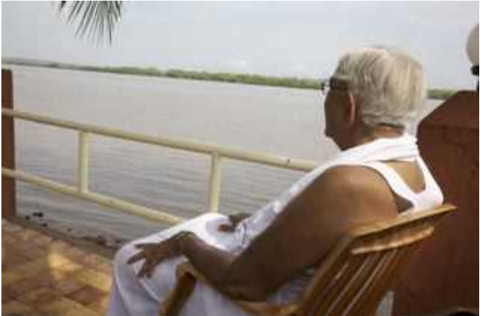
Master on the banks of the Mandovi, Goa

ಗುರುಗಳು ಮುಂಬೈಗೆ ಬಂದವೇಳೆಯಲ್ಲಿ ಹೋಳಿಹಬ್ಬವಿದ್ದಿತು. ದುಷ್ಟ ಶಕ್ತಿಗಳು ಮತ್ತು ಅಶುದ್ಧತೆಗಳನ್ನು 'ಹೋಳಿ ಬೆಂಕಿ'ಯಲ್ಲಿ ಭಸ್ಮಮಾಡಿ ಜನರು ಅದರ ಸುತ್ತಲೂ ನರ್ತಿಸಿ ಆದರಿಂದ ಪವಿತ್ರರಾಗುತ್ತಾರೆ. ಹೋಳಿಯು ಜೀವನವನ್ನು ಪುನಶ್ಚೇತನಗೊಳಿಸುವ ಬಣ್ಣಗಳ ಹಬ್ಬ. ಅಲ್ಲಿ ಬಣ್ಣಗಳಿರಲಿಲ್ಲವೆಂಬುದು ಸರಿಯೆ, ಆದರೆ ಪ್ರತಿಯೊಬ್ಬರೂ ವಿವಿಧ ಛಾಯೆಗಳ ಶಾಂತಿ, ಪ್ರೇಮ ಮತ್ತು ಸಂತೋಷಗಳನ್ನು ತಮ್ಮ ಹೃದಯದ ಅಂತರಾಳದಲ್ಲಿ ಅನುಭವಿಸಿದರು.