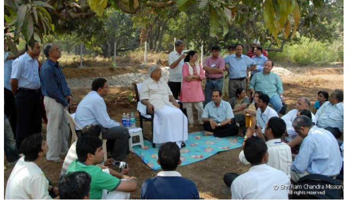
Panvel Ashram - Under the mango trees

ಮಾರ್ಚ್ 17ರಂದು ಗುರುಗಳು ಪುಣೆಯಿಂದ ಪನ್‌ವೇಲ್‌ಗೆ ರಸ್ತೆ ಮಾರ್ಗವಾಗಿ ತೆರಳಿದರು. 1400 ಪ್ರೇಮ ಭರಿತ ಹೃದಯಗಳ ಬೃಹತ್ ಸಮೂಹವು ಗುರುಗಳ ದರ್ಶನದಿಂದ ಆನಂದ ಪರವಶರಾದರು. ಎಲ್ಲರಿಗೂ ಕೈ ಬೀಸುತ್ತಾ ಪ್ರತಿಯೊಬ್ಬರನ್ನು ವಯಕ್ತಿಕವಾಗಿ ಹರಸುತ್ತಾ ಚಿಕ್ಕ ಮಕ್ಕಳು ಅವರ ಊರುಗೋಲಿನಿಂದ ತಟ್ಟಿಸಿಕೊಳ್ಳುತ್ತಿದ್ದ ದೃಶ್ಯವು ಮನೋಹರವಾಗಿತ್ತು. ಆಶ್ರಮ ತಲುಪಿದ ಗುರುಗಳು ಸತ್ಸಂಗವನ್ನು ನಡೆಸಿದರು. ಅದೊಂದು ಗಾಢವಾದ ಧ್ಯಾನವಾಗಿದ್ದು ಅಲ್ಲಿದ್ದ ಪ್ರತಿಯೊಬ್ಬರೂ ತೀವ್ರವಾದ ಆದರೆ ಅತಿ ಸೂಕ್ಷ್ಮವಾದ ಪ್ರೇಮದ ಹರಿವನ್ನು ಅನುಭವಿಸಿದರು.