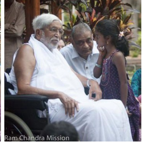
Shri Ram Chandra Mission