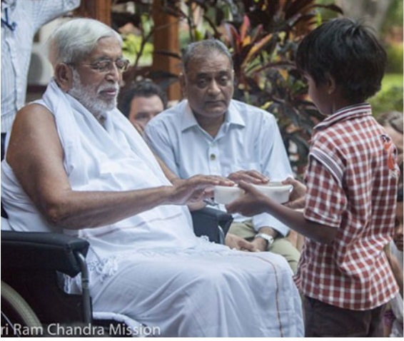
Shri Ram Chandra Mission