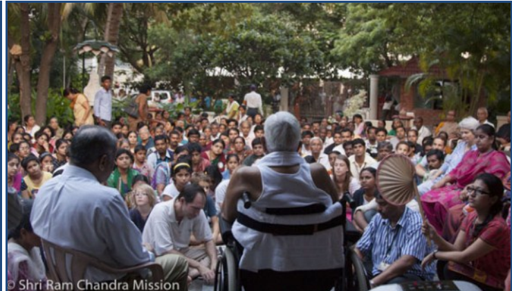
Shri Ram Chandra Mission