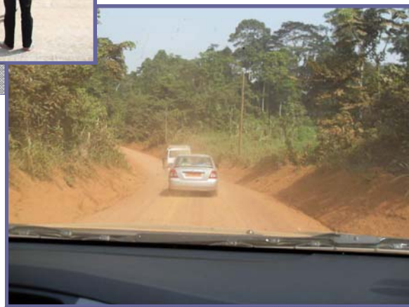
En route vers Mabine