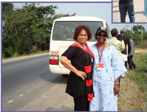
Vers le Mont Cameroun