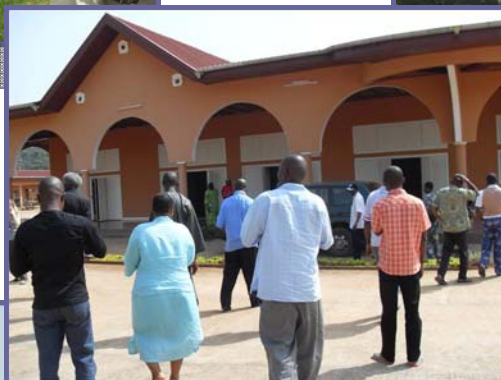
Pause à Mabine