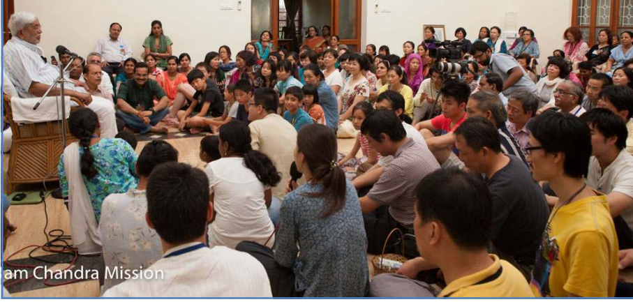
am Chandra Mission