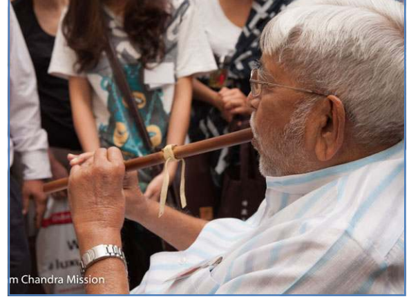
am Chandra Mission

શનિવારે સવારે, માસ્ટરે પરિસંવાદના સહભાગીઓને મળવાનો