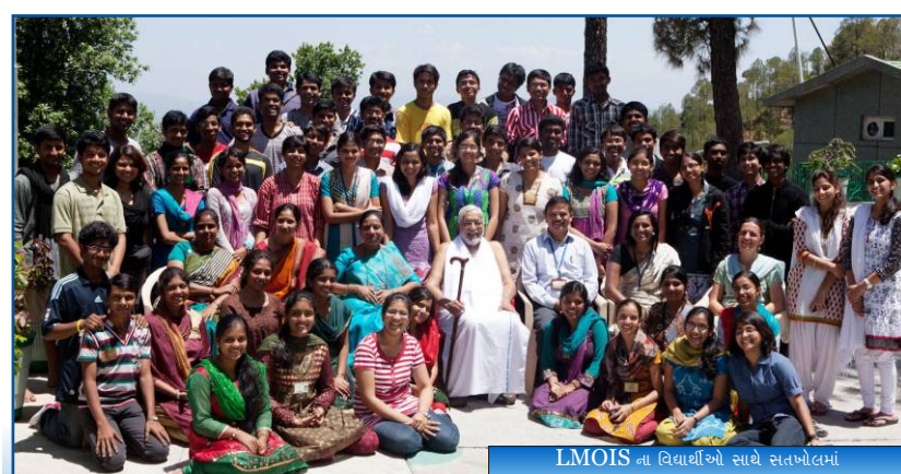
LMOIS ના વિદ્યાર્થીઓ સાથે સતબોલમાં

રરમીએ બપોરે પૂ.માસ્ટર મલેશિયન આશ્રમના ઉદઘાટન માટે તેમજ એશિયન સેમિનાર માટે મલેશિયા જવા નીકળ્યા.