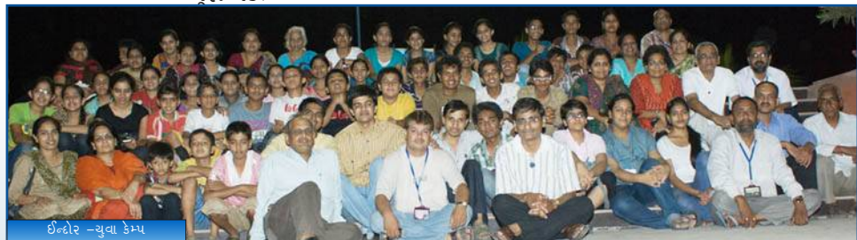
ઈન્દોર - યુવા કેમ્પ