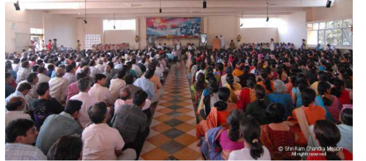
પનવેલ આશ્રમ: મેડિટેશન હોલ