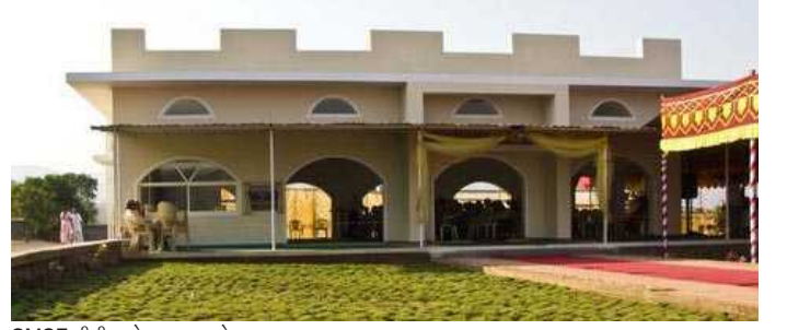
SMSF રીટ્રીટ સેન્ટર, પાનશેત