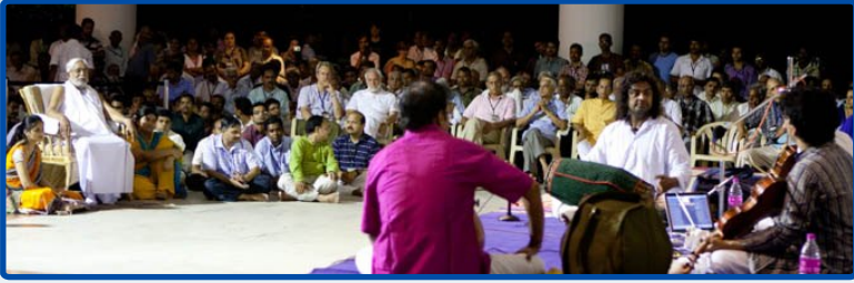
ചെന്നൈ - 27 ജൂൺ - 20 ജൂലൈ, 2011

ധാരാളം അഭ്യാസികൾ മാസ്റ്ററെ ചെന്നൈ വിമാനത്താവളത്തിൽ സ്വീകരിച്ചു. അവിടെ നിന്ന് അദ്ദേഹം നേരെ മണപ്പാക്കം ആശ്രമത്തിലേക്ക് പോയി. തന്റെ കോട്ടേജിലെത്തിയ അദ്ദേഹം ഇങ്ങനെ പറഞ്ഞു, “എനിക്കിപ്പോൾ ഊർജ്ജസ്വലസ്രോതസ്സുമായി ബന്ധം സ്ഥാപിച്ചതുപോലെ തോന്നുന്നു. എനിലിപ്പോൾ ഒരു പുതു ഊർജ്ജം നിറഞ്ഞിരിക്കുന്നു.”