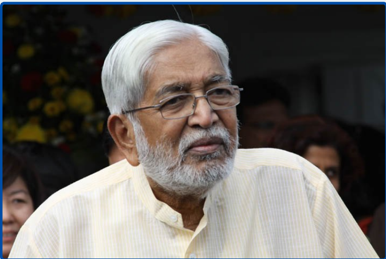
മാസ്റ്ററുടെ മലേഷ്യൻ സന്ദർശനം 2011 ജൂൺ 22 മുതൽ 27 വരെ

ജൂൺ 22-ന് ഉച്ചതിരിഞ്ഞ് മാസ്റ്റർ സിംഗപ്പൂരിൽ നിന്നും മലേഷ്യയിൽ എത്തിച്ചേർന്നു. മലേഷ്യയിലെ ക്ലാംഗ് എന്ന സ്ഥലത്ത് പുതിയതായി നിർമ്മിച്ച ആശ്രമം ഉദ്ഘാടനം ചെയ്യുവാനായി അദ്ദേഹം എയർപോർട്ടിൽ നിന്ന് നേരെ ആശ്രമത്തിലേക്ക് പോയി. വളരെ സന്തോഷവാനായി കാണപ്പെട്ട മാസ്റ്റർ അവിടെ സന്നിഹിതരായിരുന്ന 200 ഓളം അഭ്യാസികൾക്ക് ആശംസകൾ നേരുകയും സത്സംഗം നടത്തുകയും ചെയ്തു. ആ രാത്രി അദ്ദേഹം ആശ്രമത്തിൽ താമസിച്ചു. ആശ്രമത്തിൽ നിന്ന് പത്ത് മിനിറ്റ് യാത്ര ചെയ്താൽ എത്തിച്ചേരാവുന്ന പ്രിമിയർ ഹോട്ടലിലായിരുന്നു സെമിനാർ സംഘടിപ്പിച്ചിരുന്നത്. അടുത്ത ദിവസം രാവിലെ അദ്ദേഹം അങ്ങോട്ട് പോയി. ആദ്യേറ്റത്തിന്റെ പ്രായം ആവശ്യപ്പെടുന്ന സൗകര്യങ്ങൾ ലഭ്യമല്ലാതിരുന്ന ഒരു ഹോട്ടലിൽ താമസിക്കുന്നത് മൂലമുണ്ടാകുന്ന ശാരീരിക വൈഷമ്യങ്ങൾ എല്ലാം തന്നെ അനുഭവിക്കേണ്ടി വന്നുവെങ്കിലും സെമിനാർ തീരുന്നത് വരെ ഹോട്ടലിൽ തന്നെ തങ്ങാൻ മാസ്റ്റർ തീരുമാനിച്ചു.