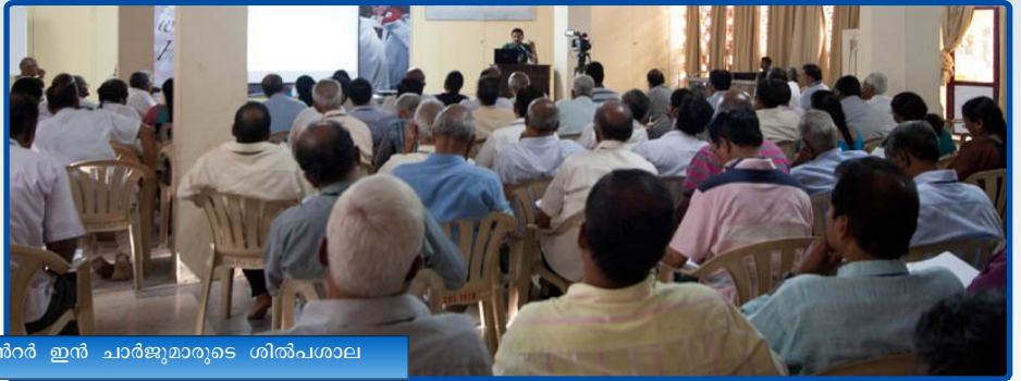
സോണൽ/സെൻറർ ഇൻ ചാർജ്ജ്മാരുടെ ശില്പശാല