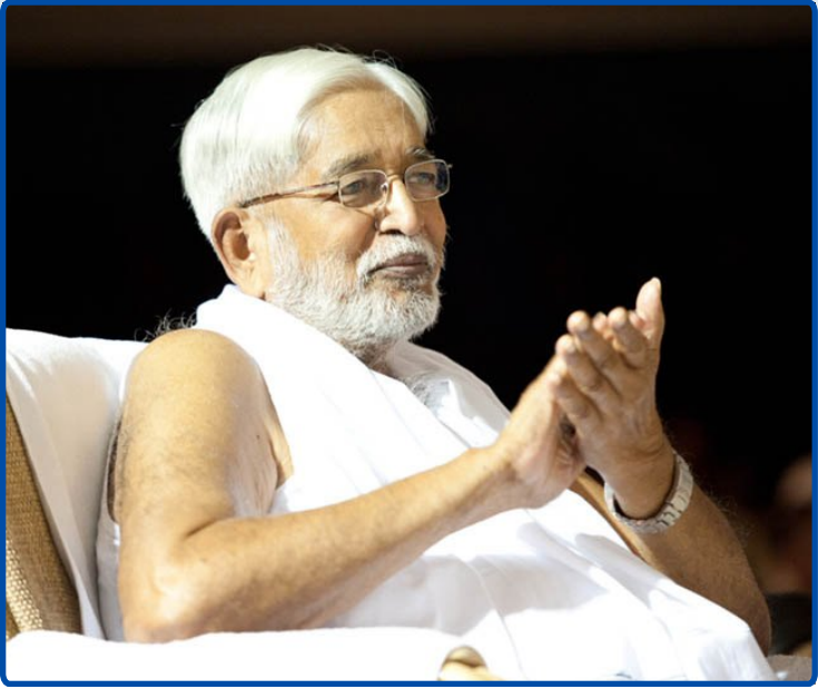
ഗുരുപൂർണ്ണിമ - വെള്ളിയാഴ്ച ജൂലായ് 15, 2011

മാസ്റ്റർ കാലത്ത് വളരെ നേരത്തെ തന്നെ തയ്യാറായിരുന്നു. ആദ്യം അദ്ദേഹം ആശ്രമത്തിൽ പുതിയതായി നിർമ്മിച്ച ആഡിറ്റോറിയം-ഗ്രന്ഥശാല സമുച്ചയത്തിന്റെ ഉദ്ഘാടനം നിർവ്വഹിച്ചു. തുടർന്ന് ധ്യാനമന്ദിരത്തിലേക്ക് നീങ്ങിയ അദ്ദേഹം 7 മണിയോടെ തന്നെ സത്സംഗം നടത്തുവാനായി എത്തിച്ചേർന്നു. ധ്യാനമന്ദിരവും അടുത്തുള്ള ഡോർമിറ്ററികളുടെ ടെറസ്സുകളും അഭ്യാസികളാൽ നിറഞ്ഞു കവിഞ്ഞിരുന്നു.