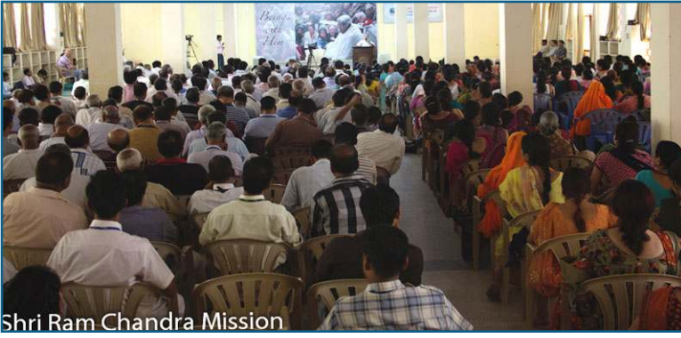
Shri Ram Chandra Mission

ಲಕ್ಕೋದಿಂದ ಬಂದ ಅಭ್ಯಾಸಿಗಳನ್ನು ಹಿಂದಿನದಿನ ಭೇಟಿಯಾಗಲು ಸಾಧ್ಯವಾಗದ ಕಾರಣ ಪೂರ್ವಾಹ್ನಿ 11 ಗಂಟೆಗೆ ಅವರನ್ನು ಡಾರ್ಮ್ A ಯಲ್ಲಿ ಭೇಟಿಯಾಗಲು ಗುರುಗಳು ನಿರ್ಧರಿಸಿದರು. ಗುರುಗಳು ಹಿಂದಿಯಲ್ಲಿ ಒಂದು ಭಾಷಣವನ್ನಿತ್ತು, ಸರಿಯಾದವುಗಳನ್ನು ಭವಿಷ್ಯತ್ತಿಗೆ ಮುಂದೂಡದೆ ವರ್ತಮಾನದಲ್ಲಿ ಮಾಡುವ ಅಗತ್ಯ ಮತ್ತು ಪ್ರಾಮುಖ್ಯತೆಯನ್ನು ಒತ್ತಿಹೇಳಿದರು. ಅವರು ಮುಷ್ಟಾಗುವ ಅನಿವಾರ್ಯ ಪ್ರಕ್ರಿಯೆಯ ಬಗ್ಗೆ ಹೇಳುತ್ತ ಅಧ್ಯಾತ್ಮವನ್ನು ವೃದ್ಧರಾಗುವಾಗ ಅನ್ವೇಷಿಸಬಹುದು ಎಂದು ಯೋಚಿಸುವುದು ಹೇಗೆ ಒಂದು ಭ್ರಮೆಯಾಗುತ್ತದೆ ಎಂಬುದನ್ನು ತಿಳಿಯಪಡಿಸಿದರು. ಬಾಬೂಜಿಯವರು ವಿವೇಕದ ಬಗ್ಗೆ ಹೇಳಿರುವುದನ್ನು ಅವರು ಪುನರುಚ್ಚರಿಸಿ, ನಾವು ಮರುಕ್ಷಣವೇ ಸಾಯಲಿದ್ದೇವೆ ಎಂಬಂತೆ ಬದುಕುವುದು ವಿವೇಕ ಎಂದರು, ತನ್ನ ಭಾಷಣದ ನಂತರ ಗುರುಗಳು, ಎಲ್ಲರೂ ಪ್ರಾತಃಕಾಲ ಆಗತಾನೇ ಸತ್ಸಂಗ ಮುಗಿಸಿಬಂದಿರುವುದರಿಂದ, ತಾನು ಇನ್ನೊಂದು ಬೈರಕ್ಯನ್ನು ಕೊಡಬೇಕೆಂದು ಕೇಳಿದರು. ಅಭ್ಯಾಸಿಗಳು ಬೈರಕ್ಯಾಗಿ ಕೋರಿದರು. ಸೇರಿದ್ದ ಎಲ್ಲ ಅಭ್ಯಾಸಿಗಳು ಅಧಿವೇಶನವಿಡೀ ಶಿಸ್ತಿನಿಂದ ಮೌನವಾಗಿ ಕುಳಿತಿದ್ದು, ನೂಕು ನುಗ್ಗಲುಮಾಡದೆ ಗುರುಗಳು ಆರಾಮಾಗಿ ಓಡಾಡಲು ಅನುವು ಮಾಡಿಕೊಟ್ಟರು.