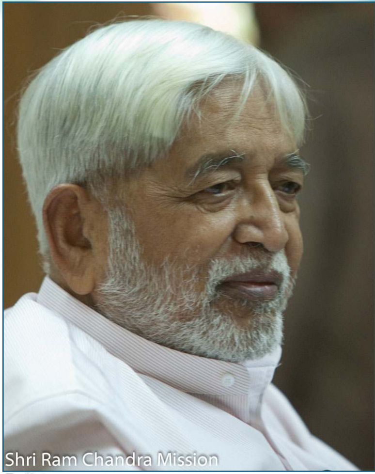
Shri Ram Chandra Mission