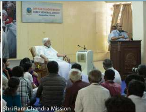
Shri Ram Chandra Mission