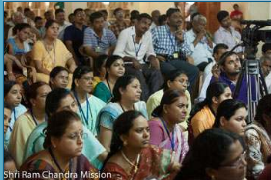
Shri Ram Chandra Mission