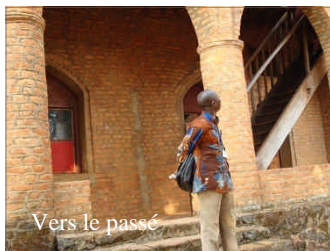
Vers le passé

Pendant ce séminaire, nous avons appris, nous avons été exhortés, guidés, motivés et surtout nous avons senti à travers vous l'amour de notre Maître. Nous souhaitons que de tels événements