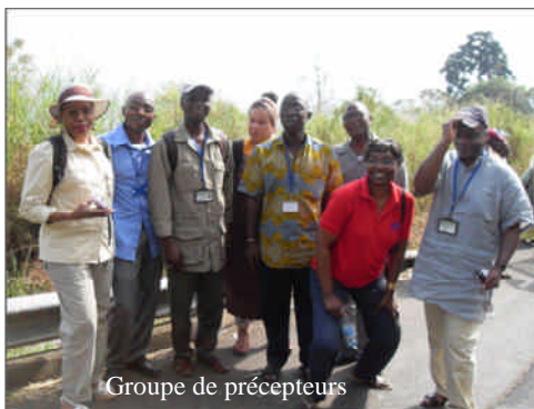
Groupe de précepteurs

Par la suite, je me demandais vraiment avec un travail aussi exigeant que le mien où j'allais trouver le temps en décembre pour ce séminaire ? Je devais parler à mon patron de