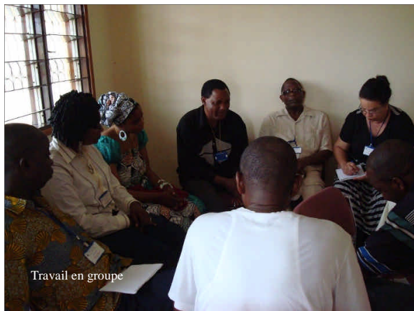
Travail en groupe

le Maître Physique parmi nous, la condition de la salle était imprégnée de sa présence. La séance de questions-réponses ayant suivi la projection du film ne fut interrompue que par