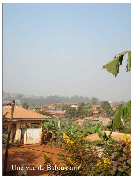
Une vue de Bafoussam